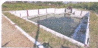
A view of Kalyani at Darasaguppe village in Srirangapatna taluk

ನಾಯಕತ್ವ ಗುಣ ಬೆಳೆಸುವ ಎನ್‌ಎಸ್‌ಎಸ್ ಕಾರ್ಯಕ್ರಮವನ್ನು ಆಯೋಜಿಸಲಾಗಿದೆ. ಈ ಕಾರ್ಯಕ್ರಮದ ಮೂಲಕ ವಿದ್ಯಾರ್ಥಿಗಳಿಗೆ ನಾಯಕತ್ವ ಗುಣ ಬೆಳೆಸುವ ಉದ್ದೇಶದಿಂದ ನಾಯಕತ್ವ ಗುಣ ಬೆಳೆಸುವ ಎನ್‌ಎಸ್‌ಎಸ್ ಕಾರ್ಯಕ್ರಮವನ್ನು ಆಯೋಜಿಸಲಾಗಿದೆ.