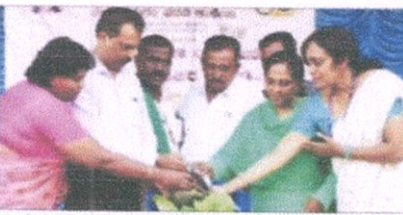
ಶ್ರೀರಂಗಪಟ್ಟಣ: ಹಾಲನಿ ದರಸಗುಪ್ಪೆ ಗ್ರಾಮದಲ್ಲಿ ಮೈಕೊನೆ ಕೊಡುತ್ತಿರುವ ಪ್ರಥಮ ದರ್ಜೆ ಕಾಲೇಜು ಹೆಚ್‌ಸಿಎಸ್‌ಸಿ ವಿದ್ಯಾರ್ಥಿಗಳಿಂದ. ಎನ್‌ಎಸ್‌ಎಸ್ ವಿಭಾಗದ ವಿದ್ಯಾರ್ಥಿಗಳಿಗೆ ನಾಯಕತ್ವ ಗುಣ ಬೆಳೆಸುವ ಉದ್ದೇಶದಿಂದ ನಾಯಕತ್ವ ಗುಣ ಬೆಳೆಸುವ ಎನ್‌ಎಸ್‌ಎಸ್ ಕಾರ್ಯಕ್ರಮವನ್ನು ಆಯೋಜಿಸಲಾಗಿದೆ.

Students later cleared weeds around the 'Gramma Udayanava' near to the Kalyani, giving it a new lease of life.