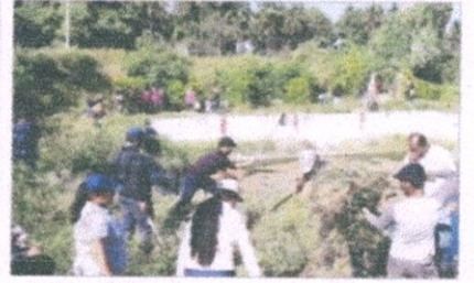
ಶ್ರೀರಂಗಪಟ್ಟಣದ ದರಗುಪ್ಪೆ ಬಳಿ 400 ವರ್ಷಗಳಷ್ಟು ಹಳೆಯ ಇತಿಹಾಸವುಳ್ಳ ಕಲ್ಲಿನಕೊಳೆಯನ್ನು ಮೈಸೂರು ಕೆಎಂಐಪಿಎಂ ಪ್ರಕಾರ ದೇಶದಾದ್ಯಂತ ಸ್ವಚ್ಛಗೊಳಿಸಿದ ಕೊಳೆಗಳ ಸಂಖ್ಯೆ 60 ಮತ್ತು ಕೆಎಂಐ 400 ಮಾರ್ಗದರ್ಶಿ ನೀಡುವುದರ ಕಡ್ಡಾಯ ಕೆಲಸವನ್ನು ಸ್ವಚ್ಛಮುಕ್ತ ಪರಿವರ್ತನಾ ಮುಖ್ಯವಾಹಿನಿಯ ಕೆಎಂಐ ಸ್ವಚ್ಛಗೊಳಿಸಿದರು.

ಶ್ರೀರಂಗಪಟ್ಟಣ: ಕಾಲುವೆ ದರಗುಪ್ಪೆ ಗ್ರಾಮದಲ್ಲಿರುವ ಕೊಳೆ ಕುಸುಕುಗೊಂಡು ಒಣಗಿಹೋಗಿದ್ದು ಎನ್‌ಎಸ್‌ಎಸ್‌ ವಿದ್ಯಾರ್ಥಿಗಳು ಸ್ವಚ್ಛಗೊಳಿಸಿದರು. ಮೈಸೂರು ಕೆಎಂಐಪಿಎಂ ಪ್ರಕಾರ ದೇಶದಾದ್ಯಂತ ಸ್ವಚ್ಛಗೊಳಿಸಿದ ಕೊಳೆಗಳ ಸಂಖ್ಯೆ 60 ಮತ್ತು ಕೆಎಂಐ 400 ಮಾರ್ಗದರ್ಶಿ ನೀಡುವುದರ ಕಡ್ಡಾಯ ಕೆಲಸವನ್ನು ಸ್ವಚ್ಛಮುಕ್ತ ಪರಿವರ್ತನಾ ಮುಖ್ಯವಾಹಿನಿಯ ಕೆಎಂಐ ಸ್ವಚ್ಛಗೊಳಿಸಿದರು. ಕೆಎಂಐಪಿಎಂ ಮೇಲ್ಮೈ ಮೇಲೆ ಎದುರಿಸುತ್ತಿರುವ ಸಮಸ್ಯೆಗಳನ್ನು, ರಸ್ತೆಗಳ ಮೇಲೆ ಕಳೆ ನಿರ್ಮಿಸುವುದು ಮೊದಲಾದವುಗಳನ್ನು ಕೊಳೆಗಳಲ್ಲಿ ಕಂಡು ಬರುವ ಕೆಲವು ಸ್ವಚ್ಛಗೊಳಿಸಿದ ಕೊಳೆಗಳ ಸಂಖ್ಯೆ 60 ಮತ್ತು ಕೆಎಂಐ 400 ಮಾರ್ಗದರ್ಶಿ ನೀಡುವುದರ ಕಡ್ಡಾಯ ಕೆಲಸವನ್ನು ಸ್ವಚ್ಛಮುಕ್ತ ಪರಿವರ್ತನಾ ಮುಖ್ಯವಾಹಿನಿಯ ಕೆಎಂಐ ಸ್ವಚ್ಛಗೊಳಿಸಿದರು. ಕೆಎಂಐಪಿಎಂ ಮೇಲ್ಮೈ ಮೇಲೆ ಎದುರಿಸುತ್ತಿರುವ ಸಮಸ್ಯೆಗಳನ್ನು, ರಸ್ತೆಗಳ ಮೇಲೆ ಕಳೆ ನಿರ್ಮಿಸುವುದು ಮೊದಲಾದವುಗಳನ್ನು ಕೊಳೆಗಳಲ್ಲಿ ಕಂಡು ಬರುವ ಕೆಲವು ಸ್ವಚ್ಛಗೊಳಿಸಿದ ಕೊಳೆಗಳ ಸಂಖ್ಯೆ 60 ಮತ್ತು ಕೆಎಂಐ 400 ಮಾರ್ಗದರ್ಶಿ ನೀಡುವುದರ ಕಡ್ಡಾಯ ಕೆಲಸವನ್ನು ಸ್ವಚ್ಛಮುಕ್ತ ಪರಿವರ್ತನಾ ಮುಖ್ಯವಾಹಿನಿಯ ಕೆಎಂಐ ಸ್ವಚ್ಛಗೊಳಿಸಿದರು.